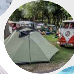
SETTORE ALBERGHIERO, CAMPING